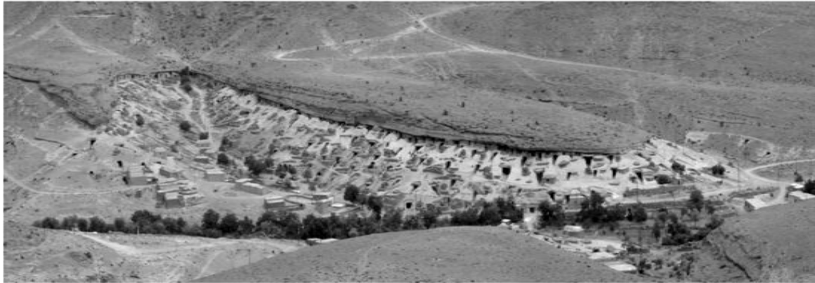
تصویر ۲: روستای صخره‌ای میمند (معصومی، ۱۳۸۵)

شهریابک محسوب می‌شوند. این بنا که در شمال شهر و در نزدیکی محله رمجرد قرار دارد، یکی از بناهای باستانی شهر است که توسط حکمرانان اسماعیلیه ساخته شده و روزگاری به خلوت آقا به مناسبت انتساب به آقاخان معروف بوده است. گرداگرد این بنای تاریخی برای جلوگیری از نفوذ دشمن به داخل آن خندق بزرگی بوده که هنوز آثار آن مشهود است.