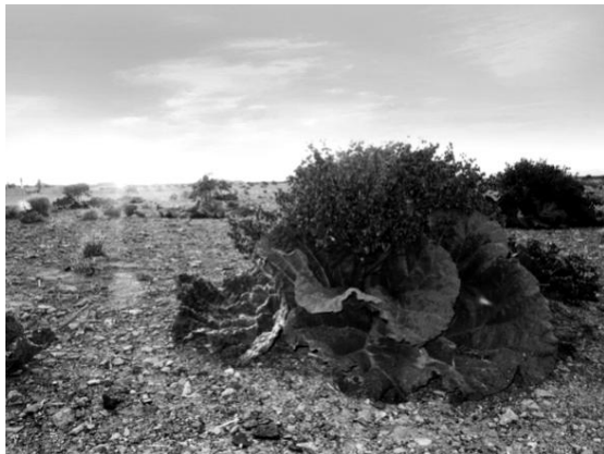
تصویر ۱: دشت ریواس شهریابک

دشت ریواس شهریابک با وسعت ۲۴۰۰ هکتار بزرگترین دشت ریواس کشور است که در شمال شهرستان شهریابک و در فاصله ۲۰ کیلومتری این شهرستان واقع شده است. این دشت در زمان